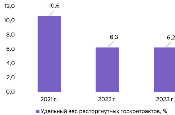
Рис. 3. Доля расторгнутых госконтрактов за период 2021–2023 гг.