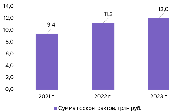
Рис. 1. Динамика сумм государственных и муниципальных контрактов за период 2021–2023 гг.