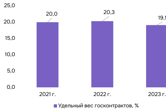
Рис. 5. Доля госконтрактов в расходах консолидированного бюджета РФ в 2021–2023 гг.

купочной деятельности на муниципальном уровне, необходимо отметить такой механизм, как создание в системе органов местного управления соответствующего муниципалитета органа (службы), централизованно осуществляющего закупки для нужд муниципальных органов, а также организаций, учредителем которых является муниципалитет. Преимуществами подобного формата является снижение коррупционных рисков, так как организацию предусмотренных законодательством конкурсных процедур осуществляет независимый орган; экономию денежных средств муниципального бюджета, в связи с тем, что закупку однородных товаров (услуг) можно осуществлять крупными партиями по оптовым ценам (например, детского питания для муниципальных дошкольных учреждений