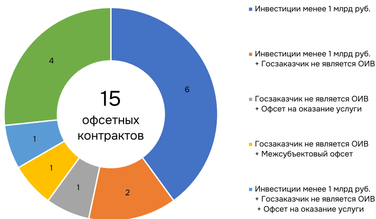
Рис. 3. Особенности офсетных контрактов, заключенных после 01.07.2024.

был заключен в 2024 г. между государственными учреждениями города Москвы и ООО «Экипировочный центр» на оказание услуг по прокату, стирке и чистке текстильных изделий. Согласно данному контракту, встречные инвестиционные обязательства инвестора составляют не менее 3 млрд руб., что является наибольшим значением из всех контрактов, заключенных после изменения 44-ФЗ.