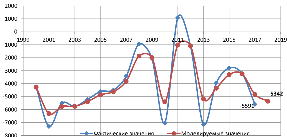
Рис. 2. Сальдо миграции в Приморском крае, чел.